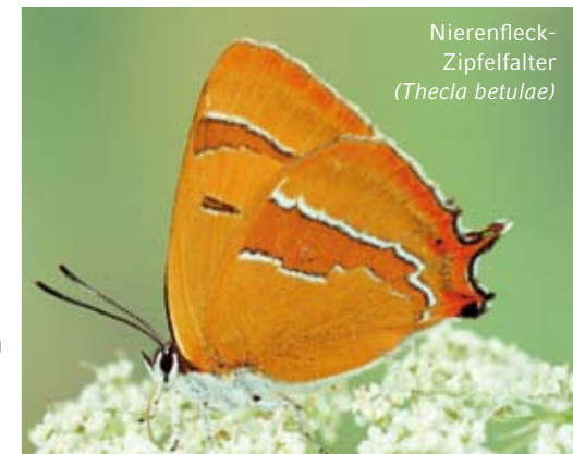
Nierenfleck-Zipfelfalter ( Thecla betulae )

welcher auf einer Länge von 12,5 km die herrliche Landschaft rund um Willebadessen erschließt.