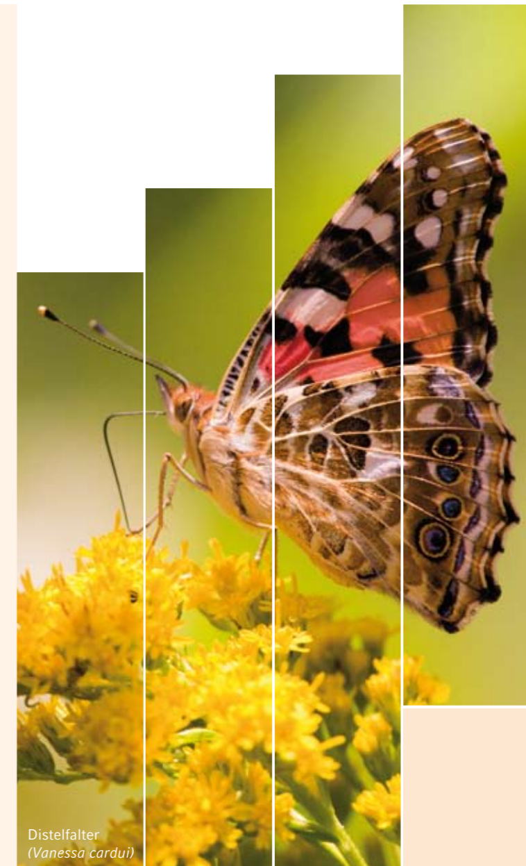
Distelfalter ( Vanessa cardui )